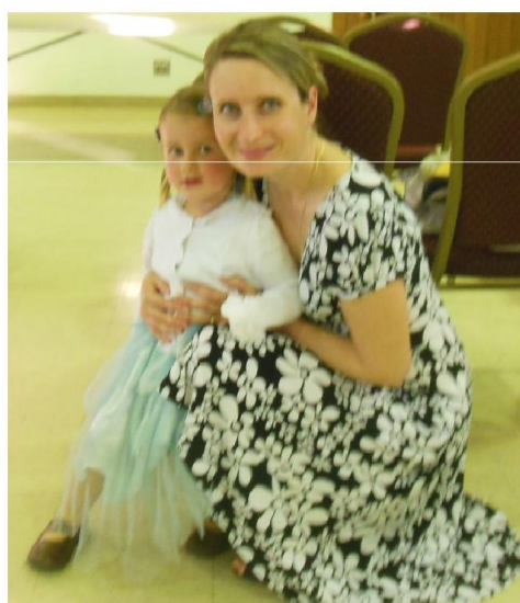
Beseda po Mše v San Diego 14. března