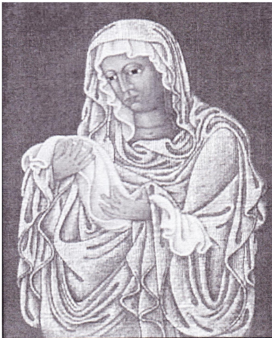
Panna Maria Lidická ve zlatém šatu na červeném pozadí

sv. Jakuba v San Diegu – sv. Františka v San Francisku - sv. Cyrila a Metoděje v Los Angeles