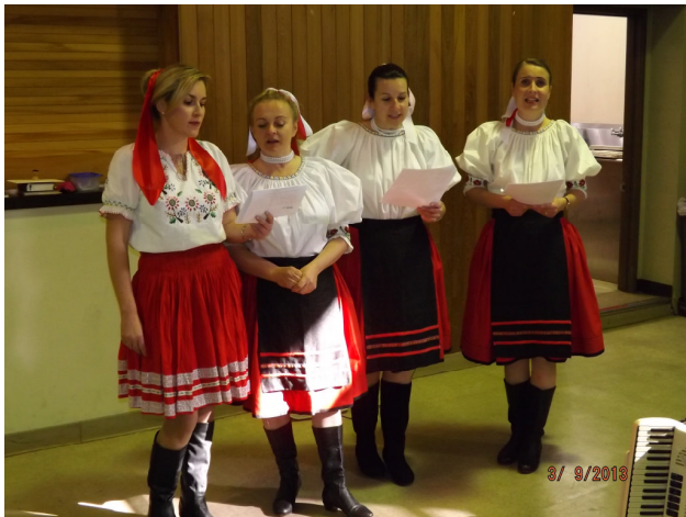
Top: Singers in San Diego entertain the bishop and guests.