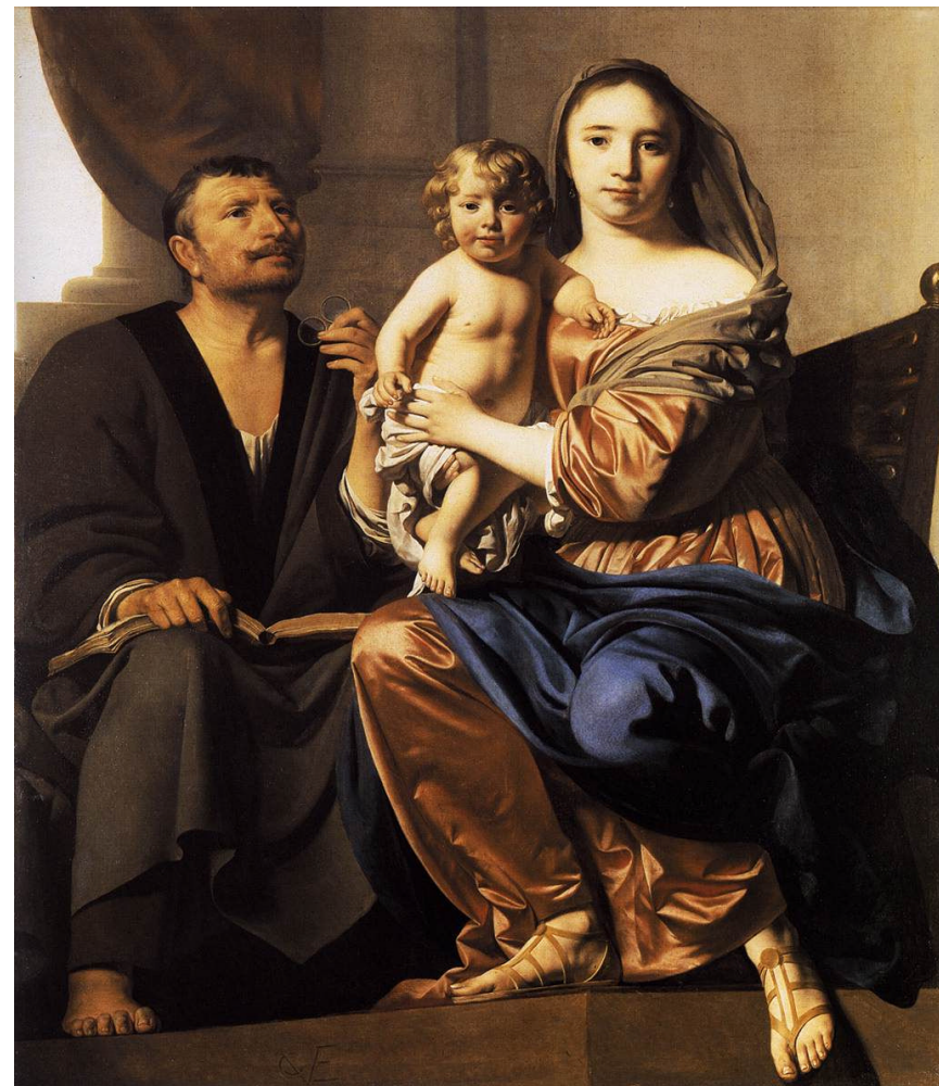
Holy Family by Ceasar Van Everdingen, 1660

sv. Jakuba v San Diegu – sv. Františka v San Francisku - sv. Cyrila a Metoděje v Los Angeles