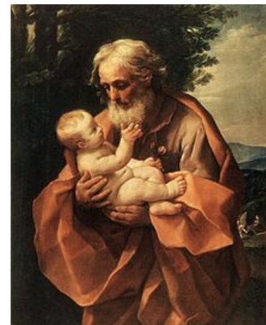
Sv. Josef 19. března, slavnost

Pocházel z královského rodu Davidova a v evangeliu je nazván mužem spravedlivým. Bohem byl vyvolen za snoubence Panny Marie. V jejich ctnostném manželství jim byla pojátkem Boží láska, která je obdařila zázračně počatým plodem, jenž se stal naší spásou. Jejich život nebyl snadný, ale naopak, protože ke spáse nevede cesta pohodlím. Přesto je plná radosti, neboť je to cesta víry, plná lásky a života ve spojení s Bohem. Sv. Josef zemřel v Nazaretě, ještě před veřejným vystoupením Pána Ježíše.