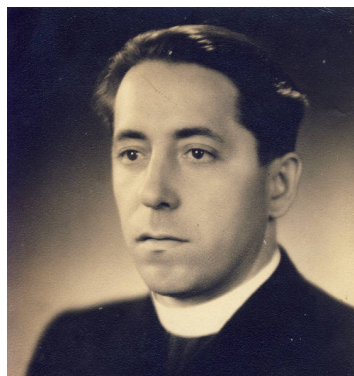
R.D. Václav Drbola

Narozen 16.října 1912 ve Starovičkách. Po studio bohosloví 5.července 1938 vysvěcen v Brně na kněze. v letech 1938-1951 v kněžské službě ve Slavkově u Brna, v Čučicích, Bučovicích a Babicích u Lesonic. 14.července 1951 nezákonně odsouzen k smrti ve spojitosti s tzv. babickým případem. 3 srpna 1951 popraven v Jihlavě. v roce 2011 zahájeno beatifikační řízení připojením k řízení Jana Buly.