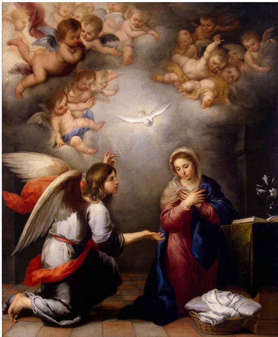
Zvěstování Panně Marii - Murillo, 1655-1660, Ermitáž v Petrohradu

sv. Jakuba v San Diegu – sv. Františka v San Francisku - sv. Cyrila a Metoděje v Los Angeles