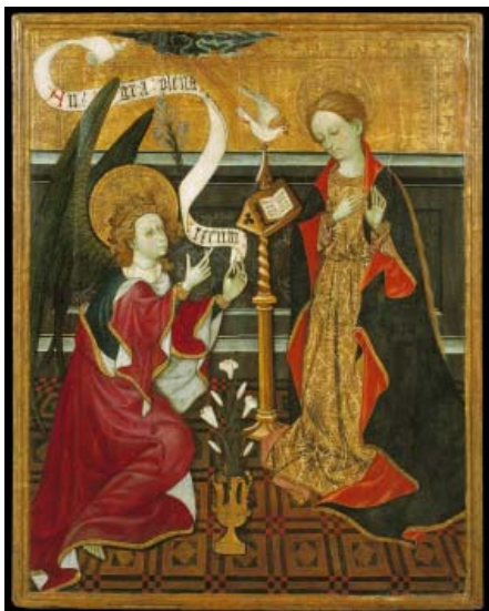
Zvěstování Panně Marii, od neznámého autora, cca. 1420, Museu Nacional d'Art de Catalunya, Barcelona

Maria řekla: „Jsem služebnice Páně; ať se mi stane podle tvého slova.“ A anděl od ní odešel.